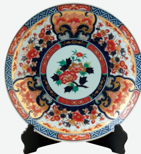
Y302 Y303 Y304 Y305