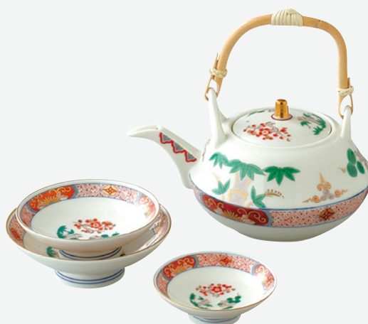
Y131 Y132 Y133 Y130