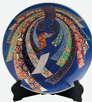
Y309 Y310 Y311