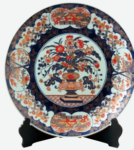
Y294 Y295 Y296 Y297