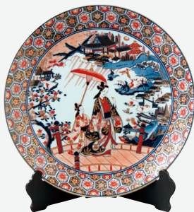
Y298 Y299 Y300 Y301